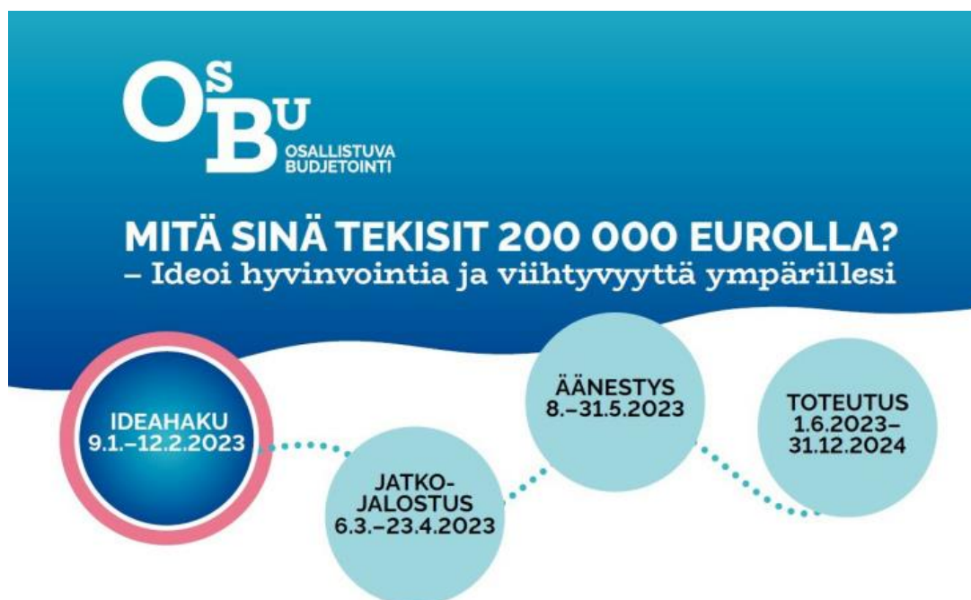
Kuva 7 Osallistuvassa budjetoinnissa asukkaat pääsevät päättämään siitä, miten kunnan käytössä olevia julkisia varoja käytetään.

Yhdenvertaisuusvaltuutetun toimistoon on puolestaan rekisteröity viimeisten viiden vuoden aikana yhdeksän Tuusulan kuntaa koskevaa asiaa, mutta yhteydenotot eivät ole johtaneet tarkempiin selvityksiin. Syrjintäperusteiksi tapauksissa on ilmoitettu tai arvioitu mielipide, terveydentila, vakaumus tai uskonto sekä vammaisuus tai useat samanaikaiset syyt. Yhdenvertaisuusvaltuutetun toimisto on käsitellyt asioita antamalla neuvontaa yhteydenottajalle, ohjaamalla hänet toiselle viranomaiselle tai arvioimalla, ettei tapauksessa synny annetuilla tiedoilla syrjintäolettaa.