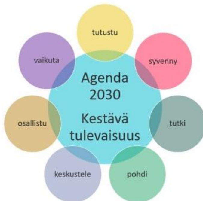
Kuva 5 Tuusulan sivistystoimen Agenda2030-tavoitteet

Joulukuussa 2022 Tuusulan kunta hyväksyttiin mukaan Unicefin Lapsiystävällinen kunta -malliin, joka perustuu YK:n lapsen oikeuksien sopimukseen. Mallin tavoitteena on auttaa kuntia tekemään lasten hyvinvoinnin kannalta oikeita ratkaisuja kunnan hallinnossa ja lasten palveluissa sekä edistämään etenkin heikoimmassa asemassa olevien lasten oikeuksia. Malli ottaa huomioon erityisesti yhdenvertaisuuden, osallisuuden, lapsen edun sekä oikeuden elämään ja kehittymiseen. Unicefin tuella etsitään pysyviä malleja Tuusulan kunnan rakenteisiin ja siihen, miten lasten ja nuorten oikeudet voitaisiin ottaa huomioon entistä paremmin. Tuusulan peruskoulujen Agenda2030-tavoitteilla toteutetaan YK:n kestävän kehityksen tavoiteohjelmaa, jossa otetaan ympäristö, talous ja ihminen tasavertaisesti huomioon. Ohjelman kantava periaate on, että ketään ei jätetä kehityksessä jälkeen. Oppilaitoskohtaiset tasa-arvo- ja yhdenvertaisuussuunnitelmat päivitettiin lukuvuonna 2022-2023. Ne päivitetään lakisääteisesti edelleen vähintään kolmen vuoden välein.