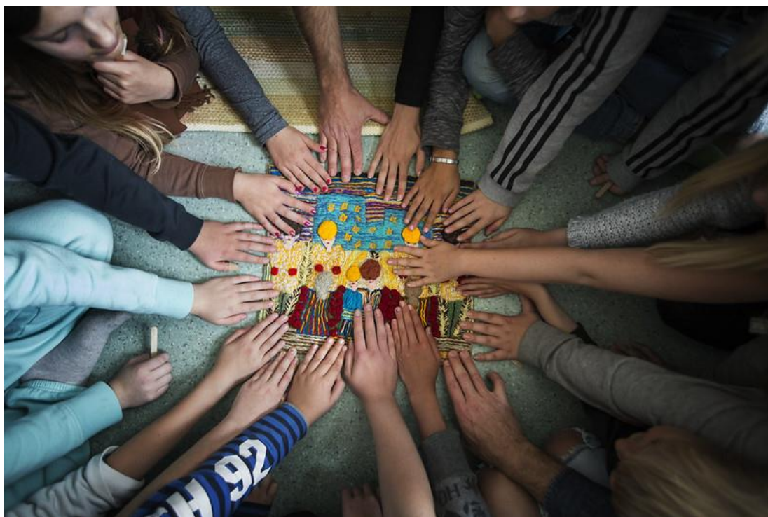
Kuva 2 Kaikki yhdessä yhteisen tavoitteen äärellä

Lapsi- ja perheasiainneuvosto esitti huolensa nuorten yhdenvertaisuudesta liittyen harrastustoimintaan, vaikuttamismahdollisuuksiin, mielenterveyteen ja kieleen. Välimatkat ovat Tuusulassa pitkiä ja julkinen liikenne niukkaa, joten lapset voivat joutua eriarvoiseen asemaan suhteessa osallistumisen mahdollisuuksiin. Liikuntaa pidetään neuvostossa erityisen tärkeänä ja siksi lasten yhdenvertaiset mahdollisuudet sen harrastamiseen pitäisi varmistaa. Neuvoston mukaan nuoret eivät osallistu tarpeeksi heitä koskevaan päätöksentekoon ja heidän vaikuttamismahdollisuutensa koetaan heikoiksi. Neuvosto toivoi, että päätöksentekoon osallistumisesta tehtäisiin nuorille houkuttelevampaa esimerkiksi parantamalla viestintää. Neuvoston mukaan kunnan viestinnässä on parantamisen varaa myös perheiden kielellisen yhdenvertaisuuden näkökulmasta. Lisäksi neuvosto oli huolissaan erilaista oppimisen tukea tarvitsevien lasten ja nuorten yhdenvertaisuudesta koulussa. Lapset ja nuoret eivät saa joutua erilaisten oppimisen tapojen ja kykyjen takia eriarvoiseen asemaan.