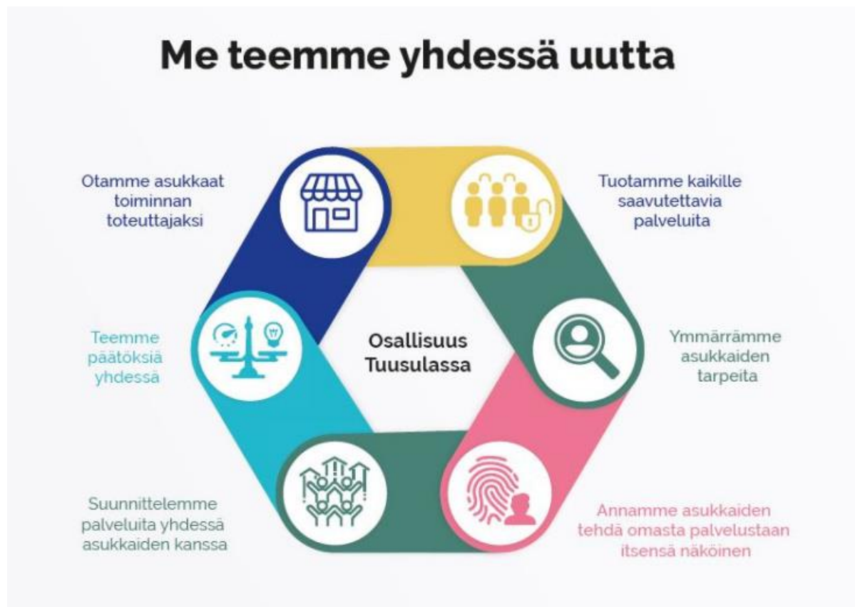
Kuva 6 Tuusulan kunnan osallisuusympyrä

Keski-Uudenmaan sote-kuntayhtymä aloitti toimintansa vuonna 2019 ja Keski-Uudenmaan hyvinvointialue 2023, mutta tuusulalaisten hyvinvoinnin ja terveyden edistäminen on myös kunnan lakisääteinen tehtävä. Kunnan tulee tarjota asukkailleen palveluohjausta sosiaali- ja terveyspalveluihin ja tehdä yhteistyötä hyvinvointialueen kanssa. Pitkittynyt ja vaihteleva koronaepidemiatilanne koetteli niin kuntaa ja kuntayhtymää kuin kuntalaisiakin vuosina 2020-2022. Osa epidemian vaikutuksista tulee näkymään vasta pidemmällä aikavälillä ja niiden suuruutta ja suuntaa voi vain arvioida. Hyvinvointi-indikaattoreiden raportointia vaikeuttaa kansallisen indikaattoritiedon päivittymisen hitaus.